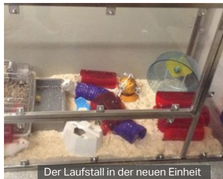
Der Laufstall in der neuen Einheit

Wir halten unsere Ratten bereits in größeren Käfigen als den Standardkäfigen und bieten eine Vielzahl von Ausgestaltungsmöglichkeiten in ihren Heimkäfigen, aber wir haben noch weitere Vorteile durch ein spezielles Rattenspielzimmer festgestellt. Einer der