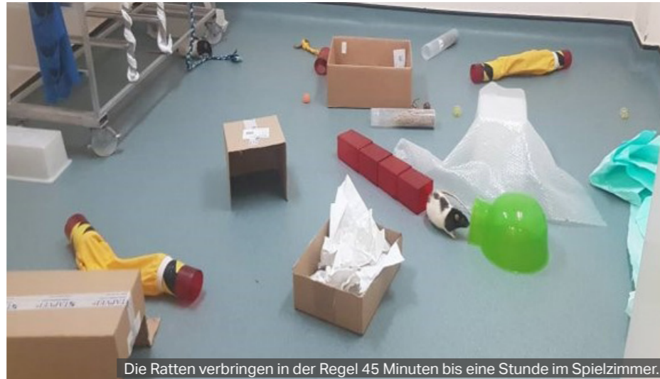
Die Ratten verbringen in der Regel 45 Minuten bis eine Stunde im Spielzimmer.

größten Unterschiede ist die Möglichkeit, sich mit den Ratten auf den Boden zu setzen und sich mit ihnen zu beschäftigen.