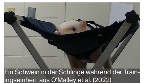
Ein Schwein in der Schlinge während der Trainingseinheit aus O'Malley et al. (2022).

O'Malley CI et al. (2022). Frontiers in Veterinary Science 9:1016414. doi: 10.3389/fvets.2022.1016414