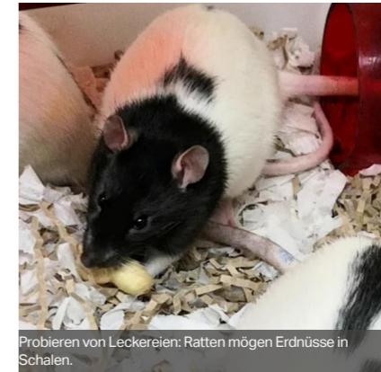
Probieren von Leckereien: Ratten mögen Erdnüsse in Schalen.

Für weitere Informationen besuchen Sie www.nc3rs.org.uk/news/making-refinements-reality-why-we-can-be-proud